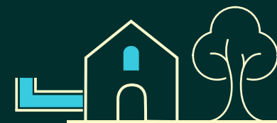
Saubere Logistik und "grüne" Immobilien